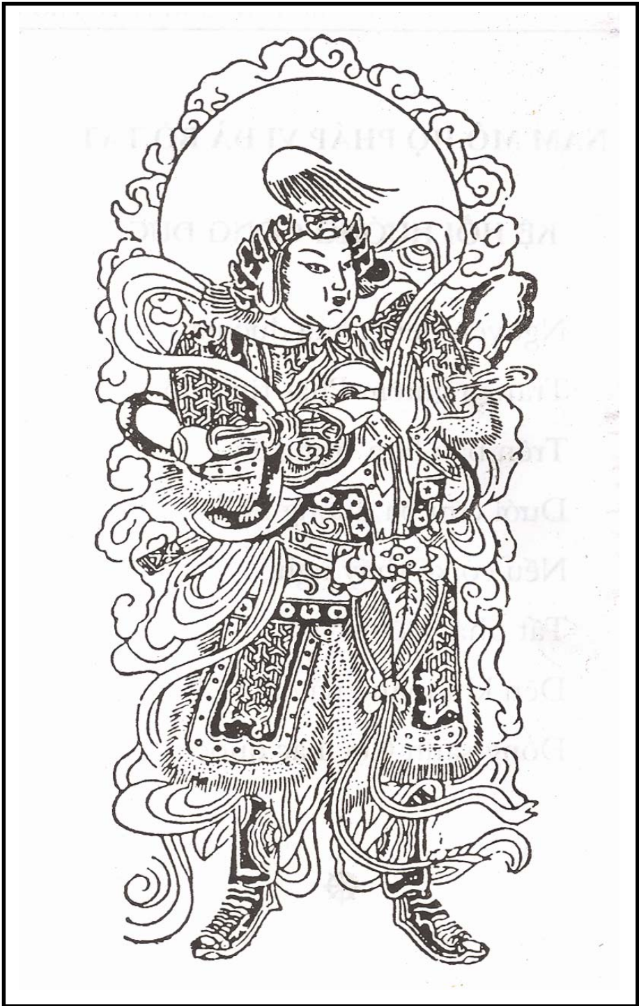
NAM MÔ HỘ PHÁP VI ĐÀ TÔN THIÊN BỒ TÁT